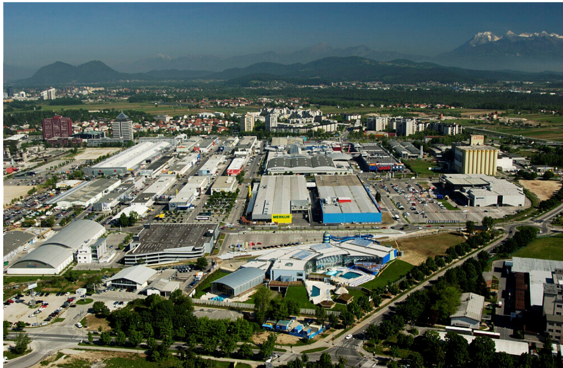
Slika 1: BTC CITY

Atlantis, ki obratuje od 22. aprila 2005 dalje, vstopa kot turistični produkt in produkt prostega časa, ki zaokrožuje celovito ponudbo BTC CITY-ja, vzpostavlja sinergične učinke med nakupovanjem, zabavo in prostim časom in dejansko dopolnjuje konkurenčno prednost BTC CITY-ja kot celote. Prav tako ljubljanski regiji in širši okolici nudi dodatne vodne in sprostitvene površine, kot do sedaj manjkajoči segment prostega časa ter možnost, da Ljubljana in Slovenija kot turistična regija ponudita nekaj več tudi turistom, da bi pogosteje obiskovali in tudi dlje časa ostajali v Sloveniji, Ljubljani. Cilj je, da turisti, ki obiskujejo ljubljansko regijo, v povprečju ostanejo dlje časa kot zgolj 2,1 dni, kar je povprečje v letu 2005.