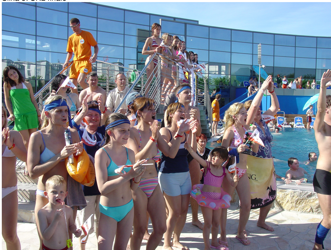
Slika 3: ŠKL finale

Čiste prihodke iz poslovanja Atlantisa predstavljajo tri vrste dejavnosti: športna dejavnost, gostinska dejavnost in dejavnost uporabe prostora. Športna dejavnost je prevladujoča dejavnost in je neposredno vezana na obiskovalce.