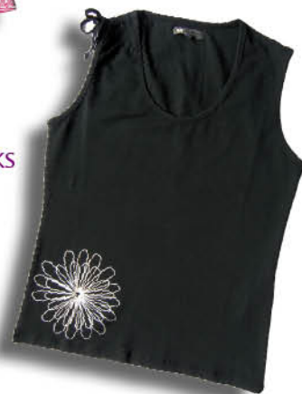
ženska majica, trgovina VARTEKS cena: 24,00 €