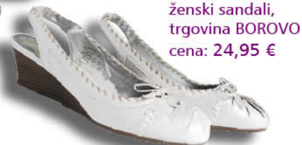
ženski sandali, trgovina BOROVO cena: 24,95 €