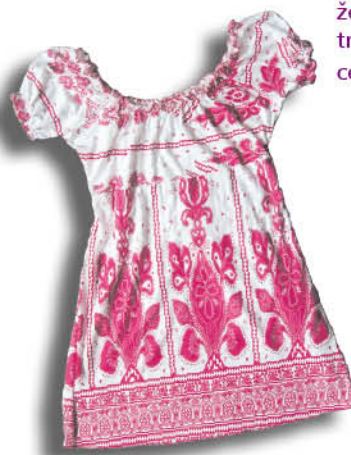
ženska tunika, trgovina TRENDY TRADE cena: 16,50 €