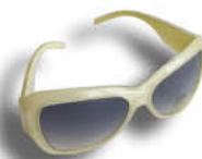
sončna očala, trgovina TRENDY TRADE cena: 2,99 €