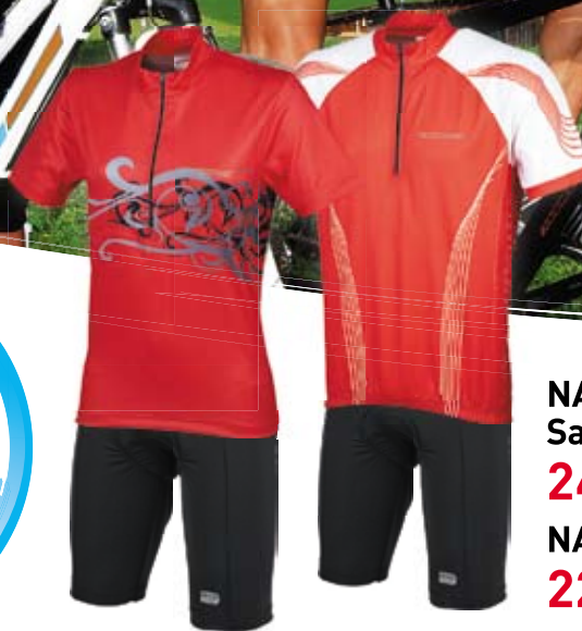
NAKAMURA Ženska kolesarska maja Salo ali moška Bardolino