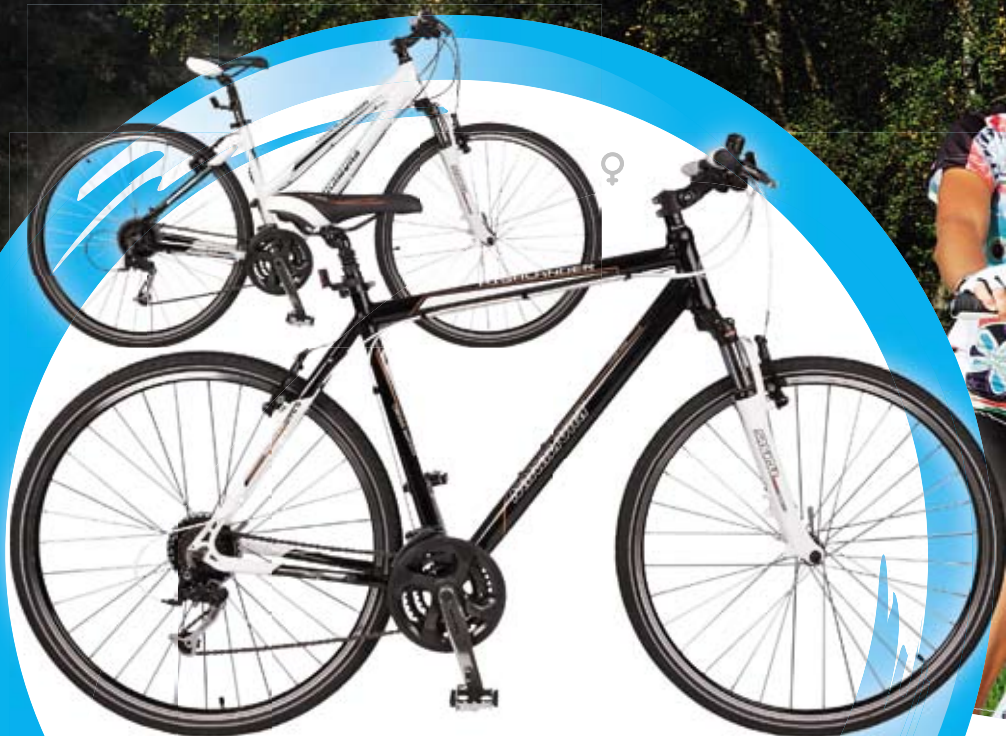
NAKAMURA Treking kolo Highlander