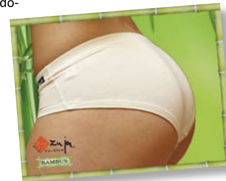
Matej Kulovec s.p., Seidlova c. 66, Novo mesto

Bamusovo vlakno vsebuje naravno antibakterijsko snov, ki preprečuje razvoj bakterij. Bambusovo perilo zmanjša možnost bakterijskih in glivičnih obolenj. Perilo iz bambusa se ne navzame človeškega vonja. Idealno je za športnike in alergike.